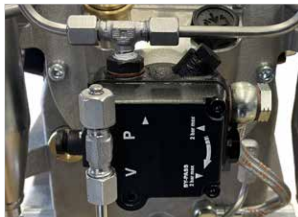
NEU - Regelbare Ölpumpe mit Ölsieb