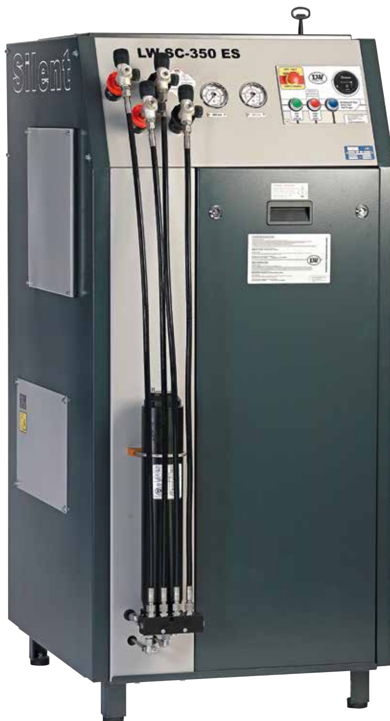
Abbildung mit folgenden Optionen:

Hohe Zuverlässigkeit, einfache Bedienung und kundengerechte Ausstattung stehen bei allen Modellen im Vordergrund.