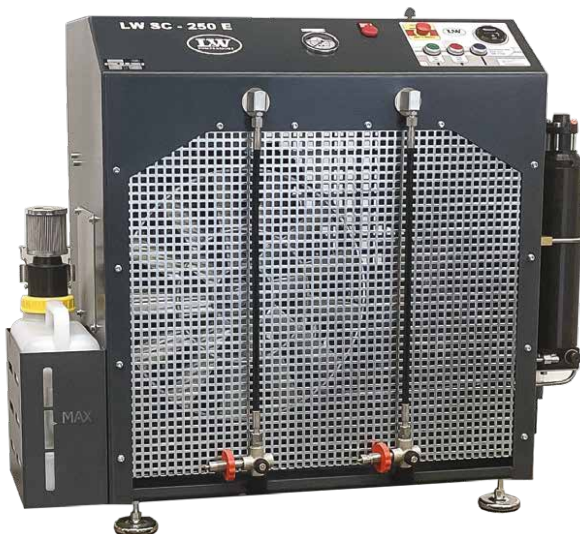
Abbildung mit optionalem Kondensatbehälter

Hohe Zuverlässigkeit, einfache Bedienung und kundengerechte Ausstattung stehen bei allen Modellen im Vordergrund.