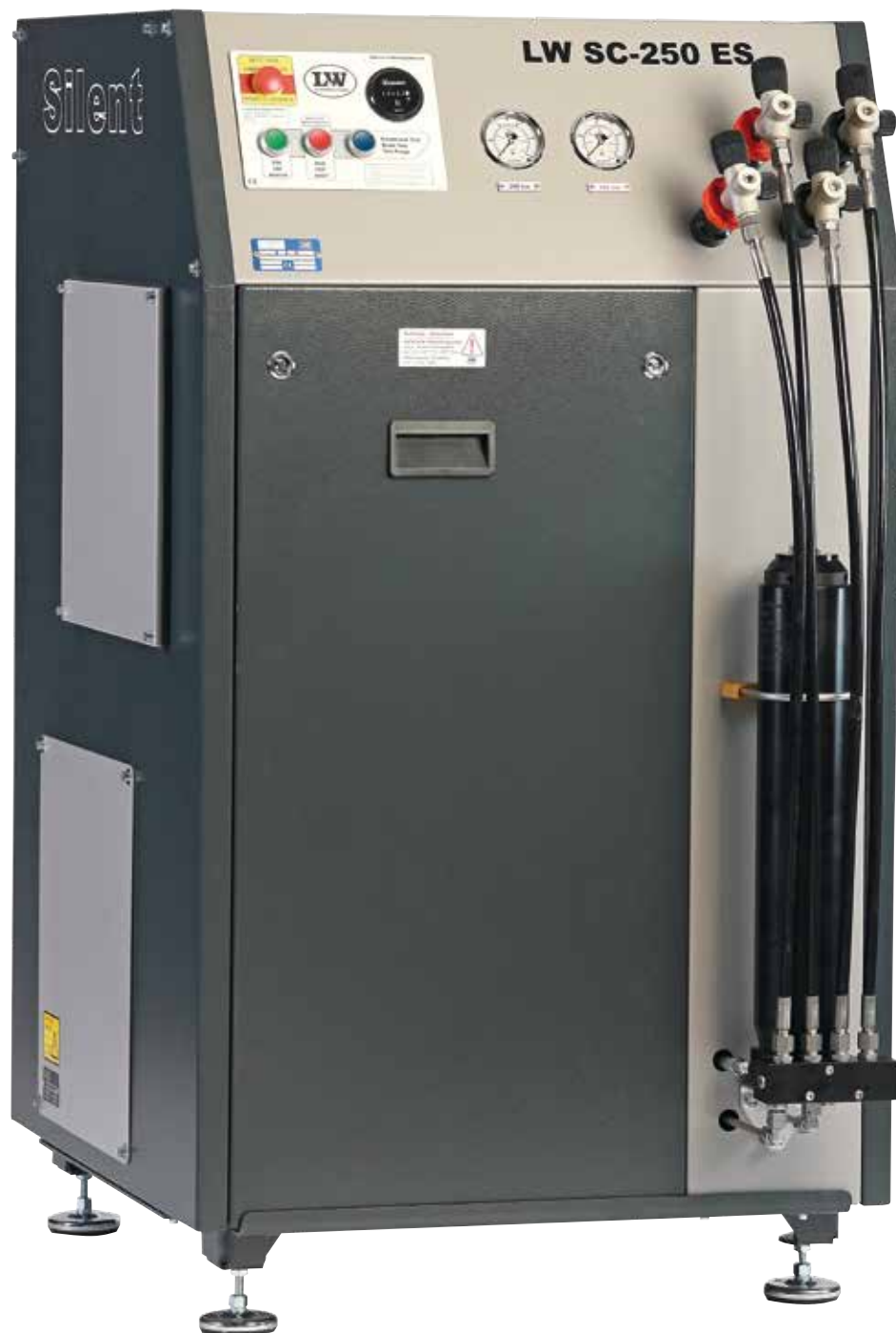
Abbildung mit folgenden Optionen:

Hohe Zuverlässigkeit, einfache Bedienung und kundengerechte Ausstattung stehen bei allen Modellen im Vordergrund.